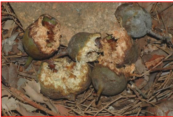
숲속빨간꼬리검은코카투가 먹다남긴 Marri nuts